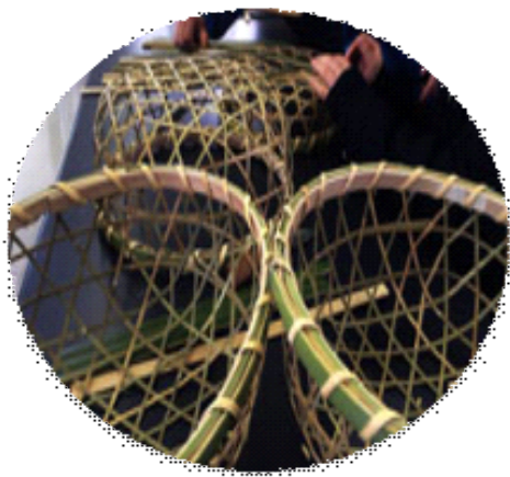
【 地域学 】