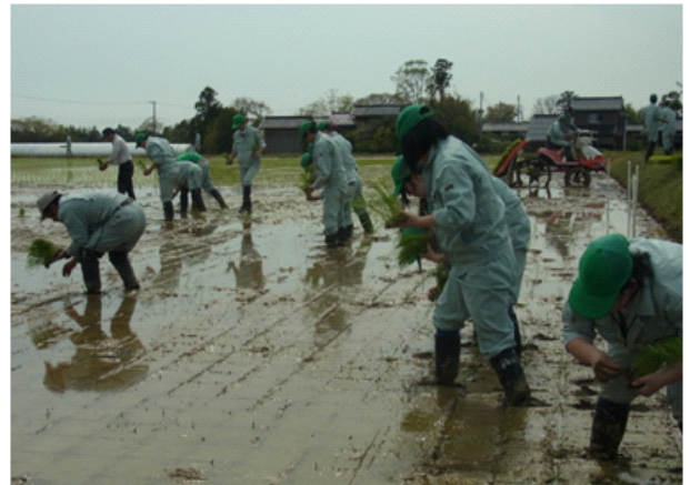
【 農産・加工 】