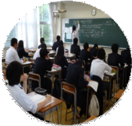
【 人文・自然 】