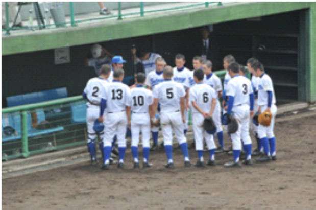
【 野球部 】