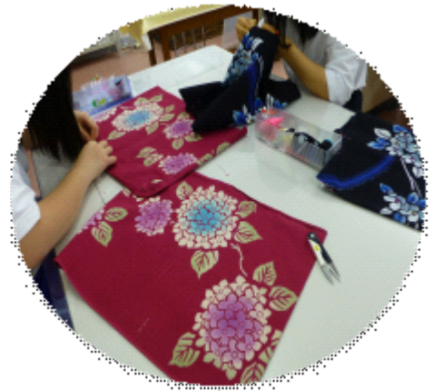
【 生活・福祉 】