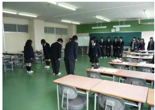
【 ビジネス・情報 】