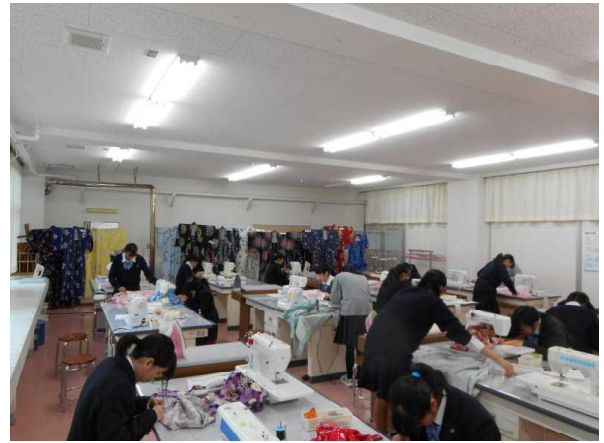
【 生活・福祉 】