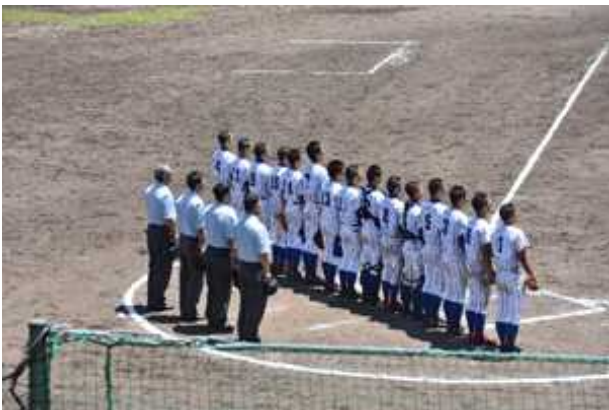
【 野球部 】