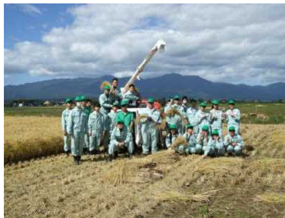
【 農産・加工 】