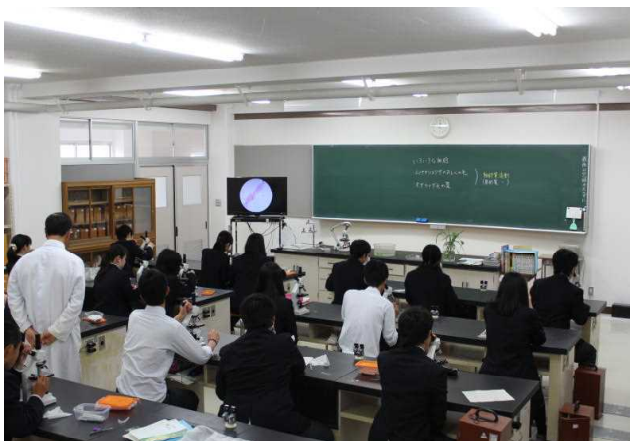
【 人文自然科学 】