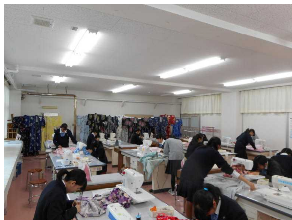
【 生活・福祉 】