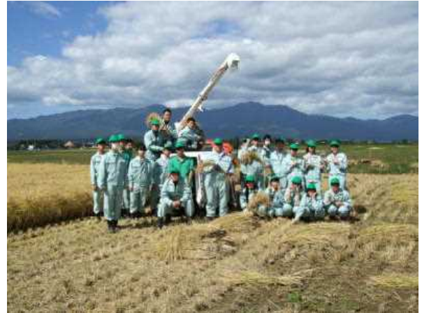
【 農産・加工 】