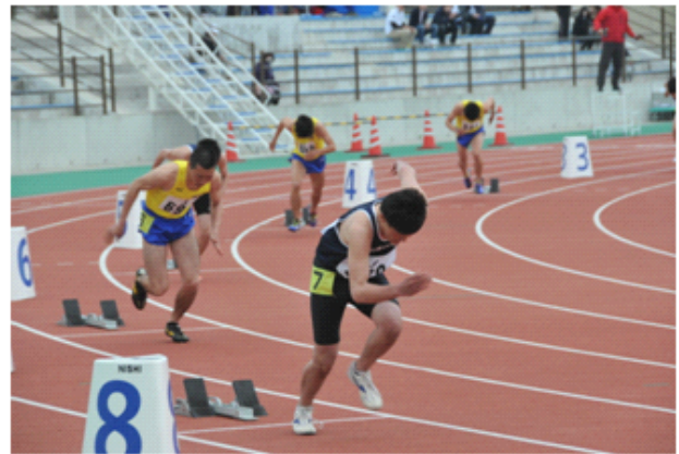
【 陸上競技部 】