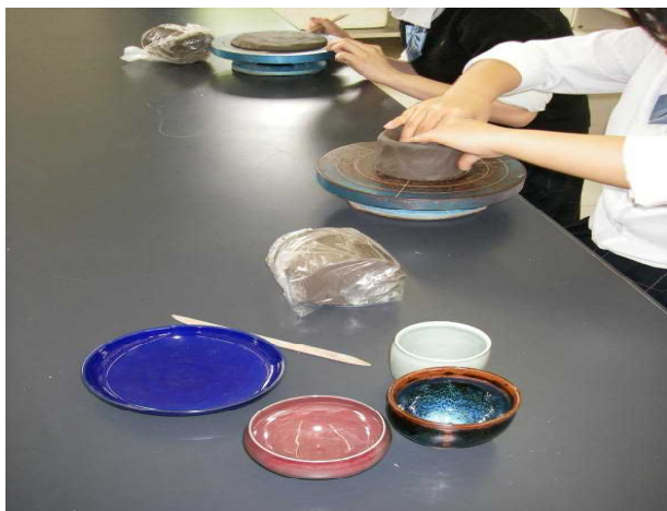
【 地域学 】