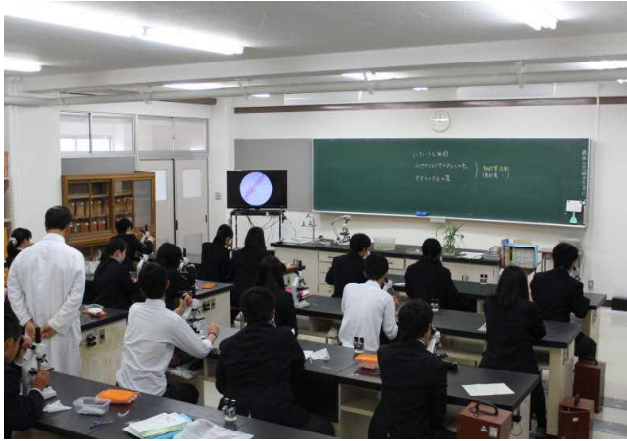
【 人文自然科学 】