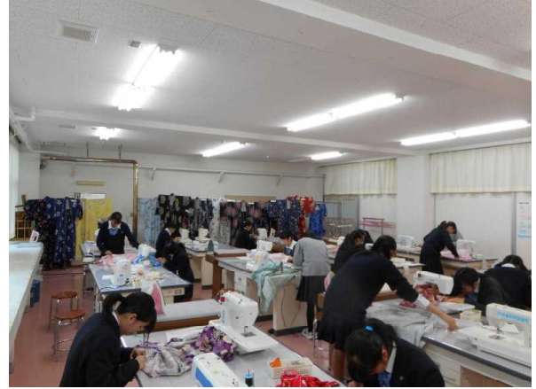
【 生活・福祉 】