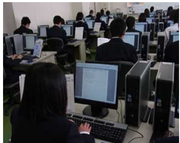
【 ビジネス・情報 】