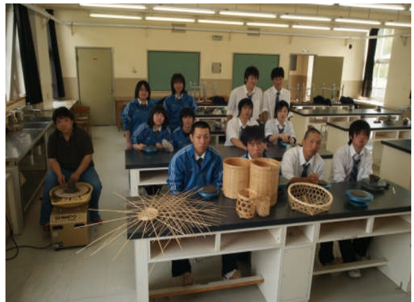
【 地域学 】