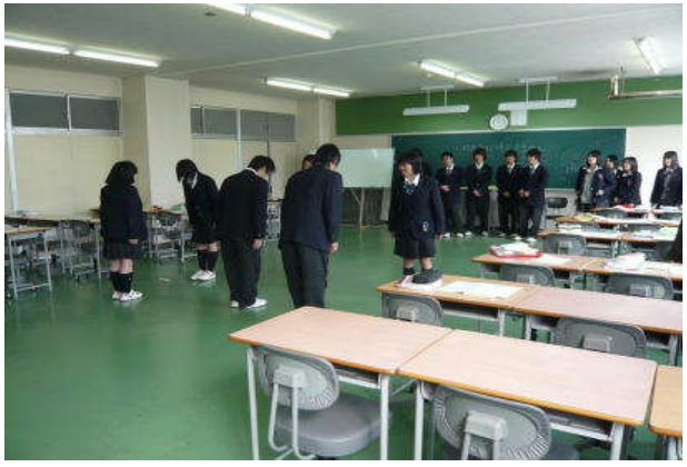
【 ビジネス・情報 】