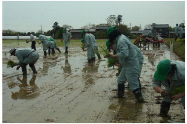
【 農産・加工 】