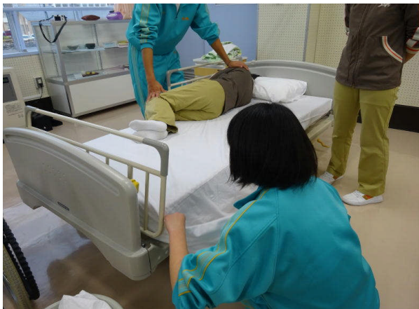
【 生活・福祉 】