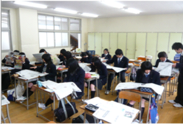
【 人文・自然 】